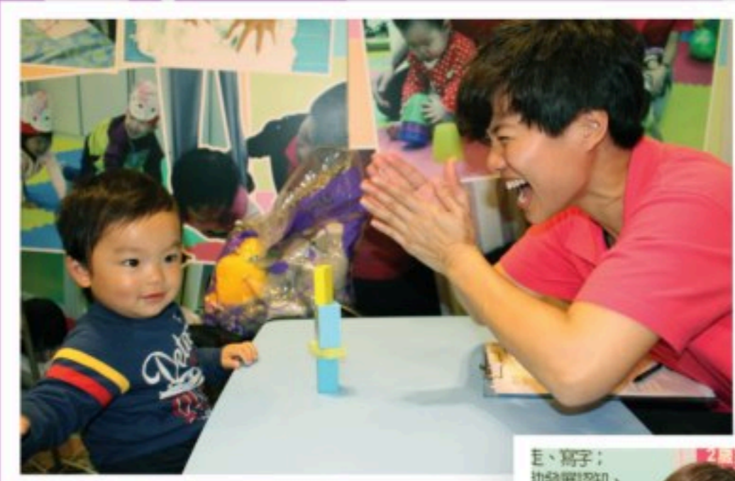
導師正在為寶寶做大小肌肉，手眼協調等評估